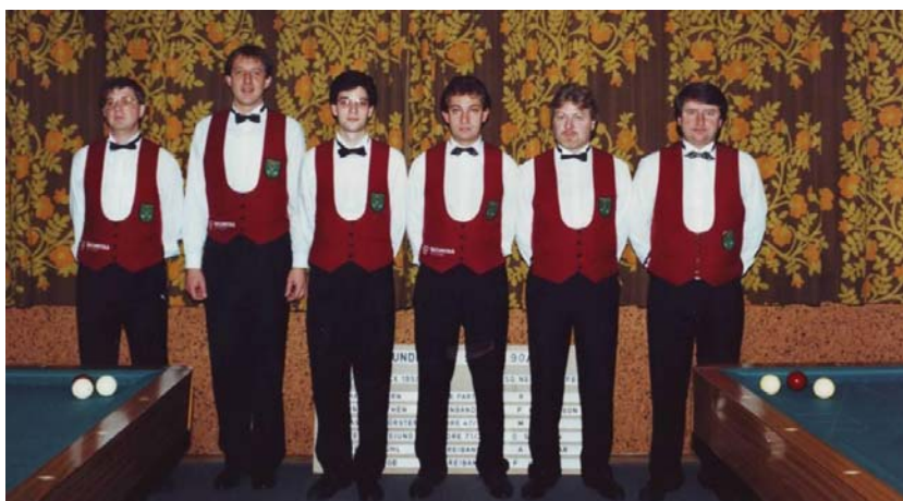
Deutscher Meister 1991 (Bundesliga-Mehrkampf)